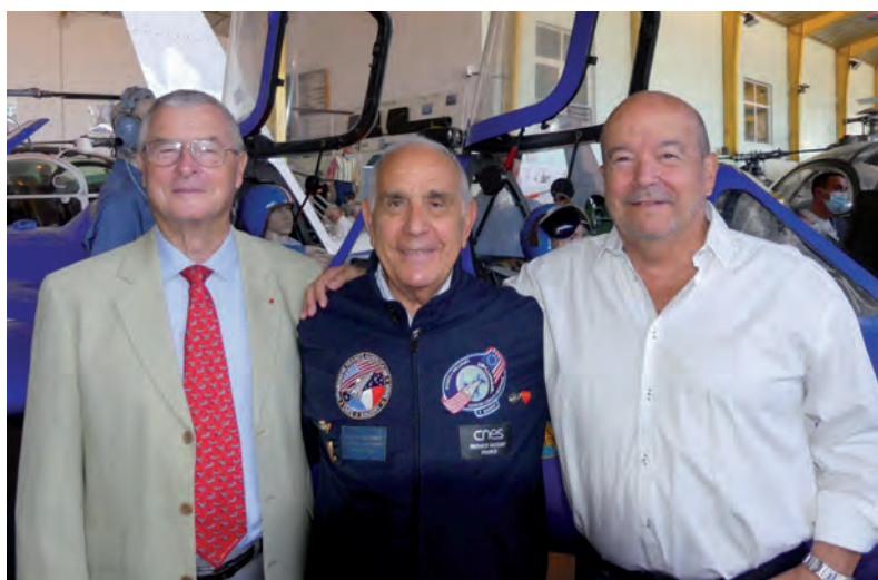
Le Maire en habit de spationaute en présence de Patrick Baudry

Les 38 èmes journées Européennes du patrimoine ont eu lieu à Saint-Victoret les 18 et 19 septembre 2021 autour du thème « Patrimoine pour tous ». La manifestation, qui a attiré une foule de visiteurs enthousiastes, fut un grand succès : pour l'occasion le musée Aéronautique de la commune a accueilli tout le week-end de nombreux visiteurs dont le célèbre spationaute français Patrick Baudry.