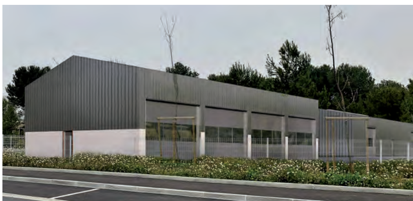
Boulevard du Général de Gaulle

Un nouveau centre technique sera bientôt construit sur l'avenue Charles de Gaulle, face à la salle de l'Odéon. L'ancien local était devenu trop étroit et ne pouvait plus recevoir tout le matériel destiné à l'entretien de la commune. Le nouveau centre technique comprendra deux bâtiments, l'un accueillera toute la partie administrative ainsi que le personnel, et l'autre, un vaste hangar, servira pour le stockage logistique.