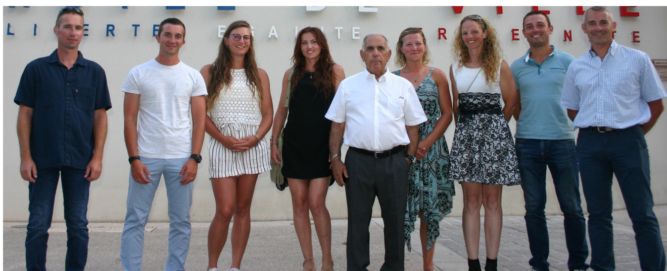
Visite des huit cavaliers du détachement de la Garde Républicaine stationnée dans la région pour l'été, en dehors de leurs heures de travail, pour remercier l'accueil chaleureux de Saint-Victoret.