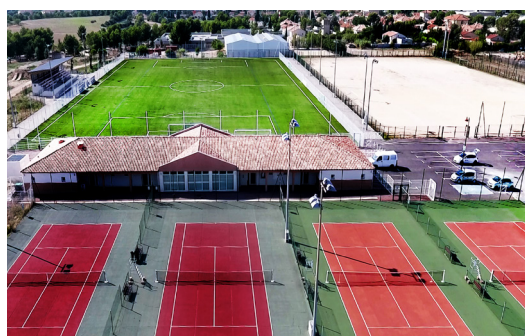
Club House et cours de tennis