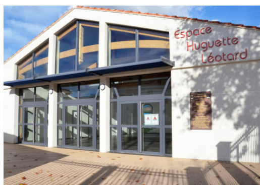
Salle Huguette Léotard