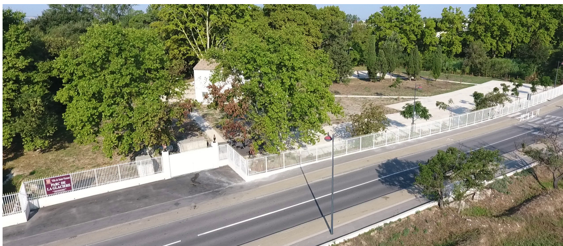
Parc de la Glacière