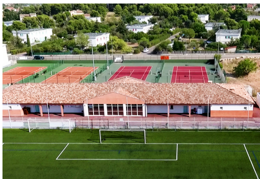
Club House et terrain de football synthétique