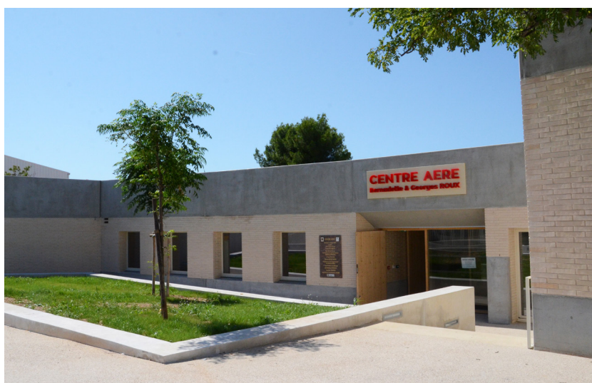
Centre Aéré Bernadette et Georges Roux