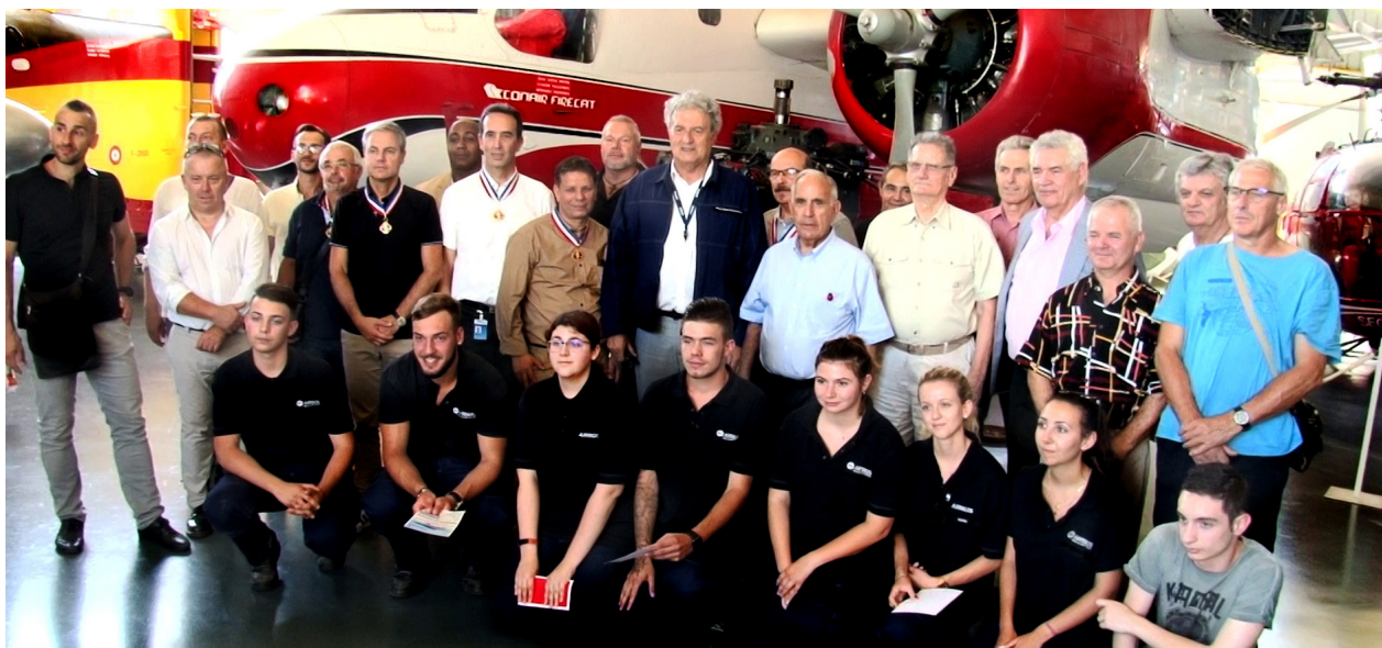
Une délégation de Meilleurs Ouvriers de France et de Meilleurs Apprentis de France d'Airbus Hélicopters a été reçue au musée de l'Aviation. Un moment instructif pour les visiteurs qui ont pu échanger avec M. Le Maire, fier de recevoir l'excellence dans sa commune.