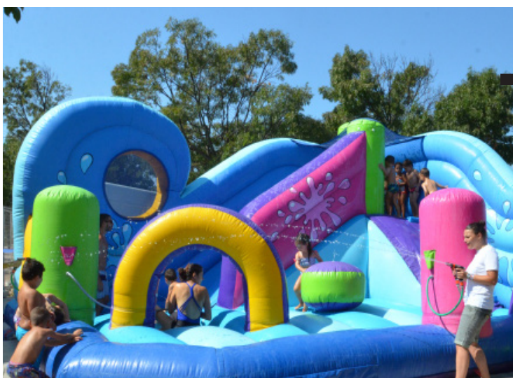
Installation de jeux gonflables

Depuis son ouverture, le centre aéré Bernadette et Georges Roux a accueilli des dizaines d'enfants. Durant la période estivale, les bambins ont pu se divertir grâce à différentes activités, lors du stage ados 2018. Au programme : Bubble bump, aqua glisse mais aussi des sorties au bowling de Plan-de-Campagne ou à l'Aquapark de Peyrolles. Sourires, éclats de rire et amusement étaient au rendez-vous.