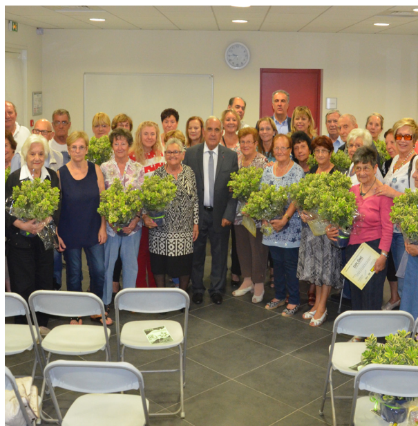
Félicitations aux lauréats.