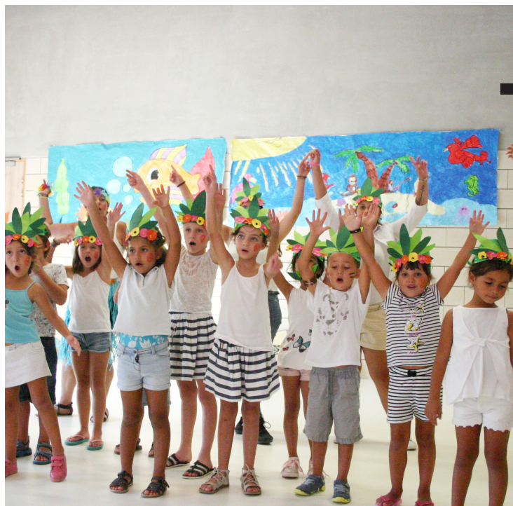
Spectacle du mardi 21 août dernier