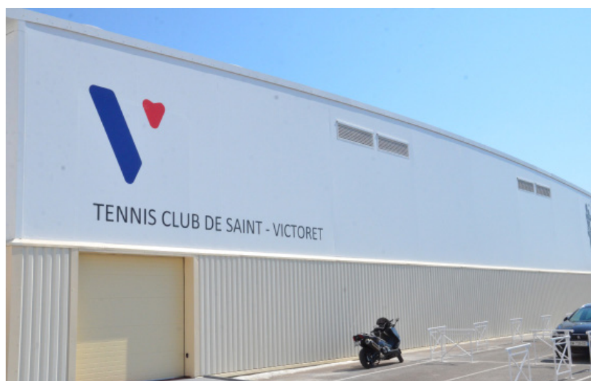
2 Terrains de tennis couverts